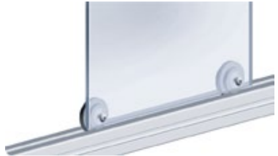
Rolle \phi 47 Roller \phi 47